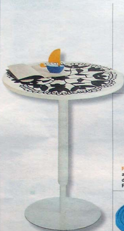
AÑEJO Y MODERNO Una mesilla que luce el dibujo de un clásico tapete de ganchillos. De Nani Marquina y Ricard Ferrer. 267 euros.

BAZAR CREATIVOS, IRÓNICOS Y DIVERTIDOS. OBJETOS DISEÑADOS PARA PONER UNA SONRISA EN TU CASA.