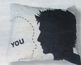
PARA SOLTEROS Fundas de almohada modelo Solteros de la diseñadora sueca Cecilia Lundgren. Para no sentirse tan solos. 19 euros.