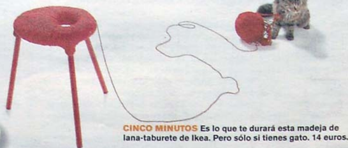
CINCO MINUTOS Es lo que te durará esta madeja de lana-taburete de Ikea. Pero sólo si tienes gato. 14 euros.