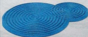
NI GOTA Déjate atrapar por la danza hipnótica de estas alfombras de baño de plástico azul. Como dos gotas de agua. De B-Sign. 43 euros.