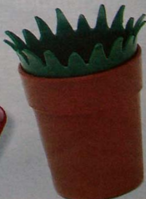
MINIJARDÍN Una maceta de hierba en la que plantar tu cepillo de dientes. Para no ahorrar la casa de tu abuela en el campo. De B-Sign. 15 euros. ■ TACHY MORA