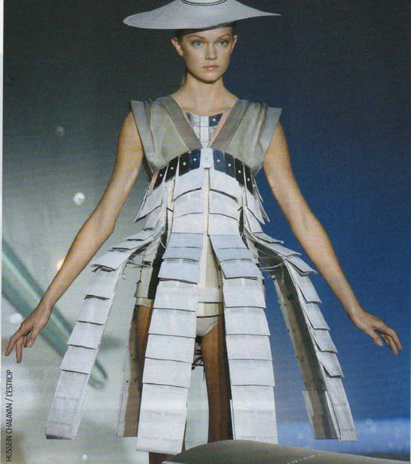
HUSSEIN CHALAYAN / L'ESTROP

Proyecto para el Museo de Arte de Tel Aviv, expuesto en la muestra Skin+Bones . Hasta el 7 de marzo en el MOCA de Los Ángeles.